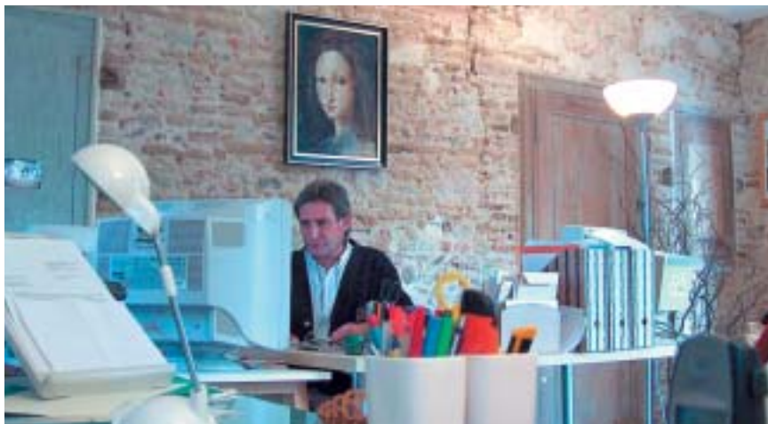
Milédits - Maison d'édition

Dans un futur proche, ils souhaitent travailler en tant qu'éditeur en publiant et diffusant des œuvres littéraires et artistiques de nouveaux talents de notre région. D'ores et déjà, ils ont en préparation une revue bimestrielle : «Littérart» destinée à un large public pour goûter à tous les plaisirs de l'art littéraire et pictural dans des découvertes inattendues récentes ou non. Nos «metteurs en livres», comme ils aiment à se présenter, vous attendent pour tout conseil.