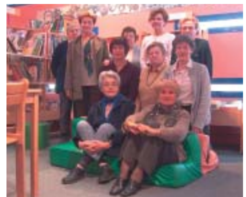
L'équipe de bénévoles de St Paul