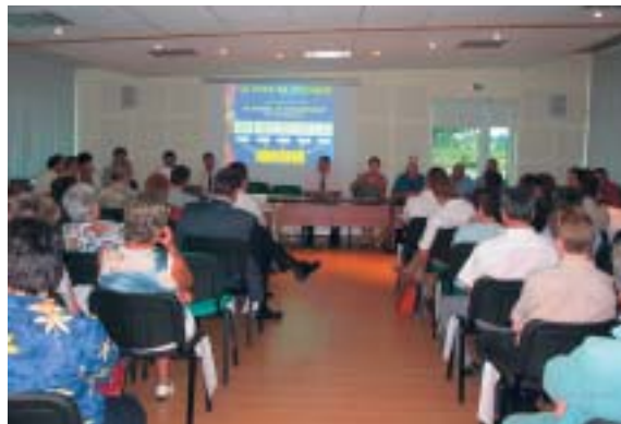
Réunion du Conseil de Développement

Il propose des actions concrètes et met en place des groupes de travail sur des problématiques particulières (chantier pays). Il donne aussi son avis sur des projets soutenus par le Pays, enfin il participe à l'évaluation annuelle du Contrat.