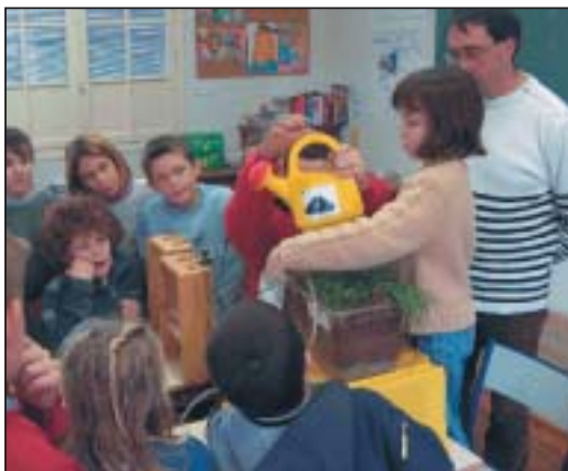
Ecole de Viterbe

* CPIE : Centre Permanent d'Initiative pour l'Environnement.