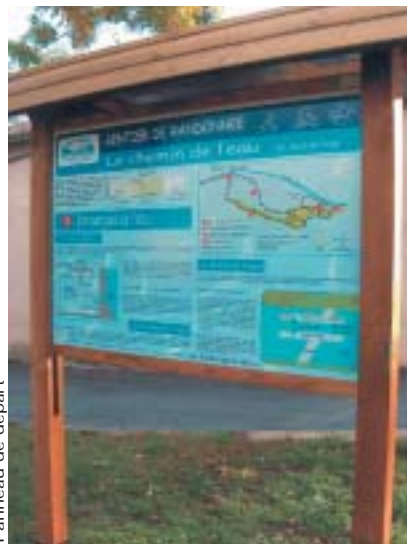
Panneau de départ