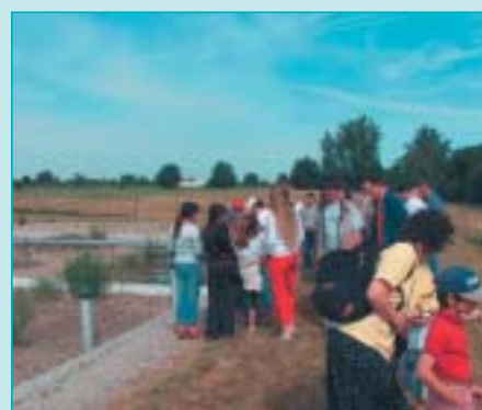
Visite de la station d'épuration de Viterbe/Brazis

Les 50 personnes qui sont montées dans le bus le samedi 12 juin 2005 ont participé à la "journée portes ouvertes" sur trois sites :