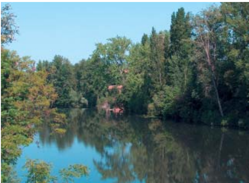
Vue du pont entre Guitalens et L'Albarède

La prise de conscience collective de la part des habitants, des agriculteurs et des industriels ainsi que l'amélioration de l'assainissement restent encore des défis à relever pour redonner à l'Agout ses lettres de noblesse .