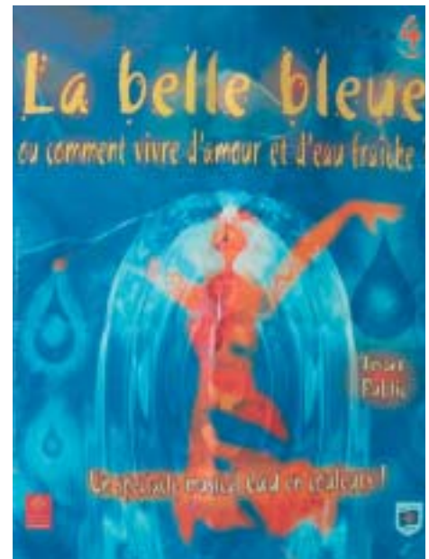
Affiche Compagnie du 4

V ous étiez plus d'une centaine à découvrir le spectacle "La Belle Bleue", le 24 mai 2005 à la salle des fêtes de Damiatte. Ce fut l'occasion de passer une bonne soirée en présence de la "Compagnie du 4" et de se rappeler l'importance de l'eau pour nous et dans le monde. Grands et petits se sont passionnés pour ce spectacle où la gravité et la prise de conscience rimaient avec poésie, magie et rêverie. La Compagnie du 4, basée à St Sulpice, se veut une compagnie "éco-citoyenne" portant haut et fort la prise de conscience environnementale.